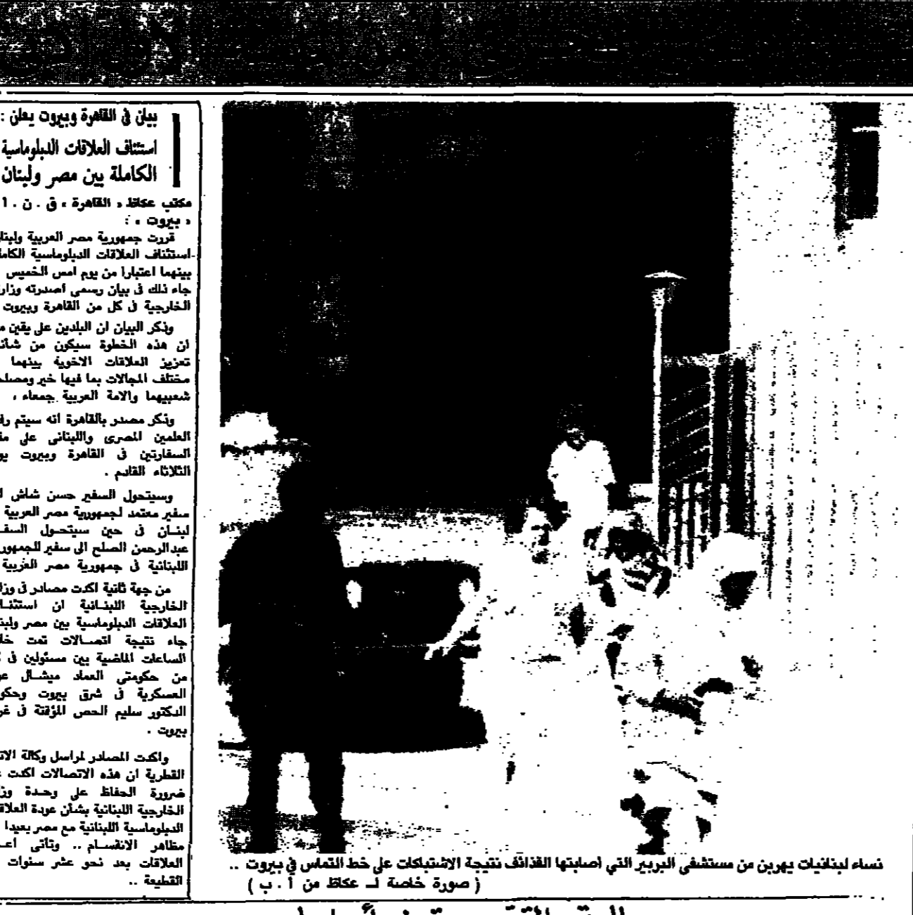
نساء لبنانيات يهرين من مستشفى البربر التي اصابتها الذئبة نتيجة الاشتباكات على خط التماس في بيروت

اليوم في عكاظ ● الامير محمد بن سعود يفتتح معرض فيبته الاعايج الاسلامية بالباحة ● الوطن ص ٢ ● امانة المدينة المنورة تقوم بجولات ميدانية على المحلات التجارية والمطاعم ● الوطن ص ٢ ● الملكة تتشارك في مؤتمر الاتحاد الدولي للعلوم الالاربية بمراكش ● احدثات الوطن ص ٤ ● بعد ٢٠ عاماً.. لأول مرة: حفل لخريجات كلية الاقتصاد والادارة - هو وفي ص ١٤ ● تهيئة حكم اللبريات الدولية.. مقال ● عمر سالم بالقرص ● الراء ص ٩ ● عكاظ ترصد ذروة الحركة في اسواق مكة المكرمة: موسم الحج خصوصية في العرض ● المال والاقتصاد ص ١٠ ● مؤسسات الطراوة الاملية ● حياة النفس ص ١١ ● وزارة الصحة تدعو الراغبين من الحج الى التطعيم للوقاية من الحمى المخفية الشوكية.. لخبار الوطن ص ٤ ● اكثر من ١٦٨٠ دائرة اتصال دولية في خدمة الحجاج ● الاخرة ص ١٩ ● منظمة العفو الدولية تدعو ال شطف عالمي على بكن ● احدثات الساعة ص ٦ ● وطن الحب.. يستقبل ● الاطبال.. ويحضى بهم ● الاخرة ● الغراء يواصلون تقديم تهنيتهم باحتفال الملكة المنقل في فوز باطلان بكاس العالم للشاشين ● عكاظ الرياضية ص ١٨